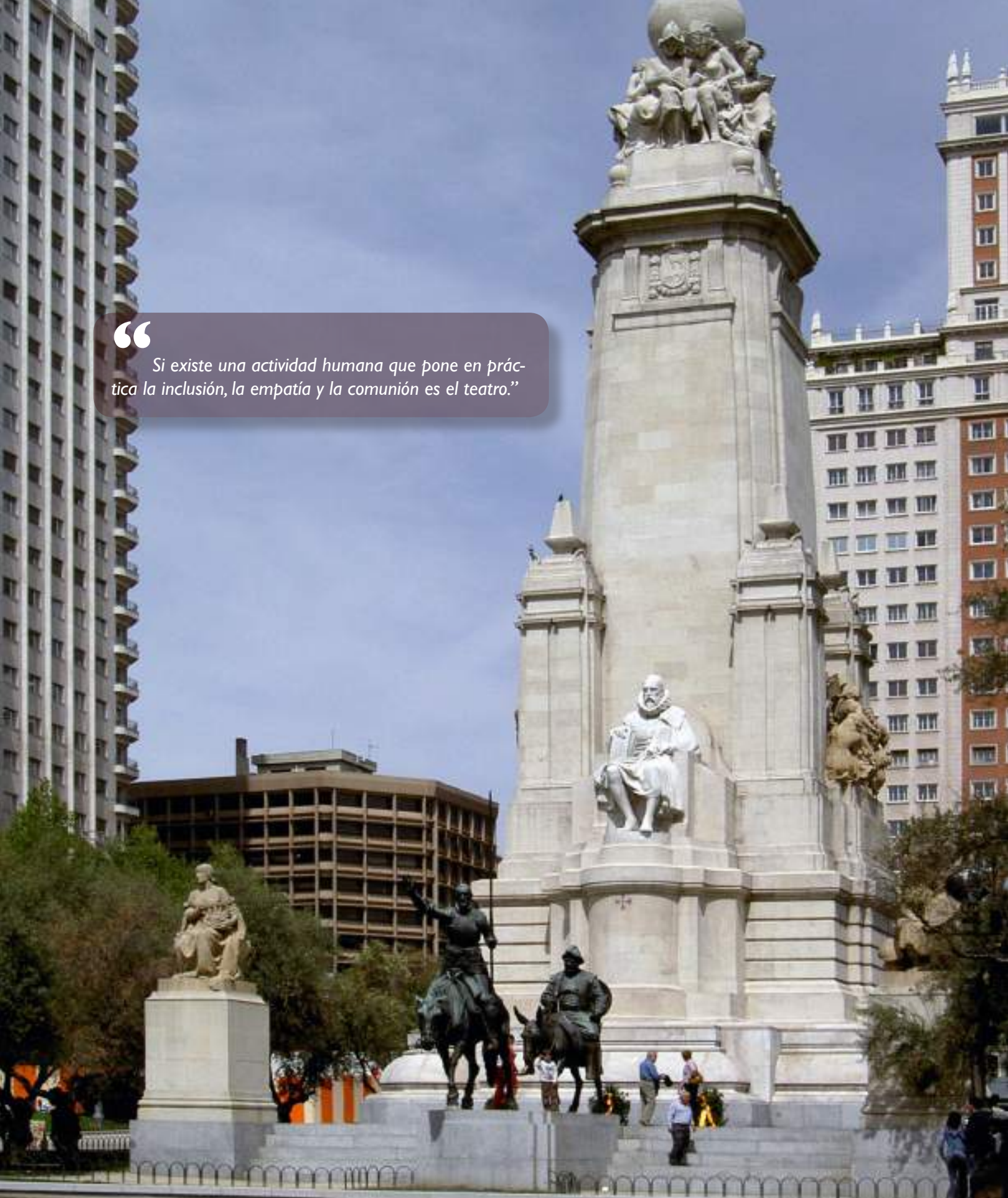
Monumento a Cervantes en Madrid. [Imagen].

Si existe una actividad humana que pone en práctica la inclusión, la empatía y la comunión es el teatro.”