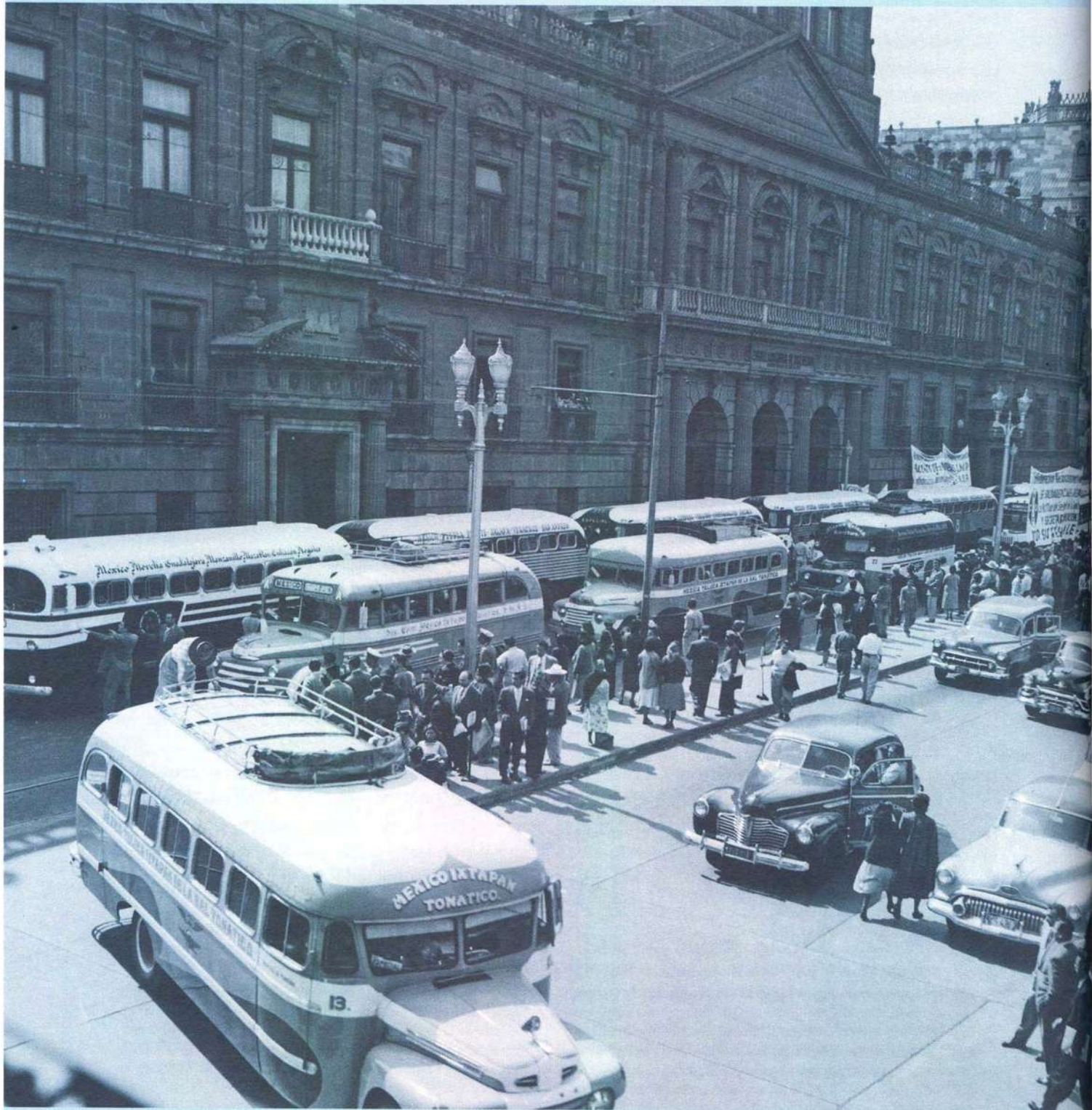
Paro del servicio de autotransporte federal a las afueras de la Escuela Nacional de Ingeniería, AHUNAM, Colección Carlos Lazo y Saúl Molina, doc. CL-SM-E191-6.