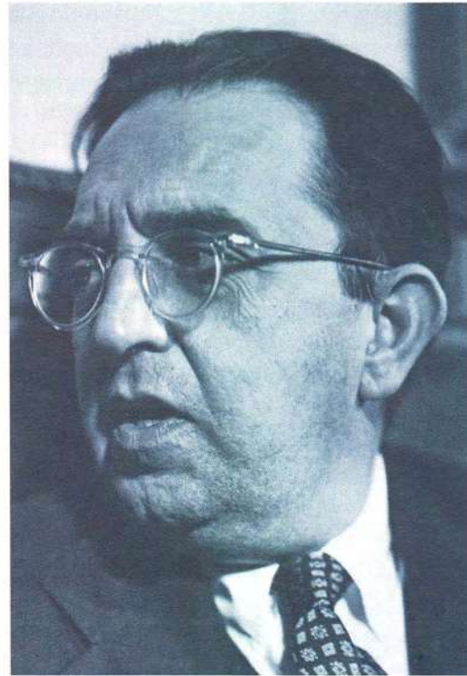
El rector Alfonso Caso (1944-1945)

Los ex rectores fijaron los requisitos de elegibilidad y regularon el proceso electoral. Para ello se basaron en la misma idea de “despolitizar” la elección de los representantes estudiantiles y académicos en el Consejo Universitario. En un documento aprobado en una reunión con los directores recién nombrados, el rector fue más allá de estas pautas. 38 Inspirado por las reglas que estableció Brito Foucher, Caso armó un mecanismo electoral complejo controlado directamente por éste. 39 Así, en la práctica, los representantes del